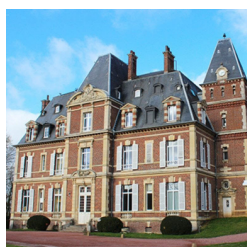
Centre spirituel de Troussures