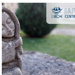
La Ferme de l'Arche