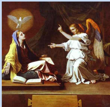
Nicolas POUSSIN , L'Annonciation, 1655.